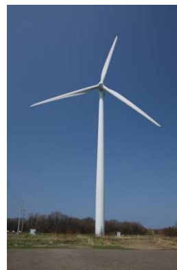
図3. (左) 伝統的風車（オランダ型），（右）風力発電用風車（プロペラ型）