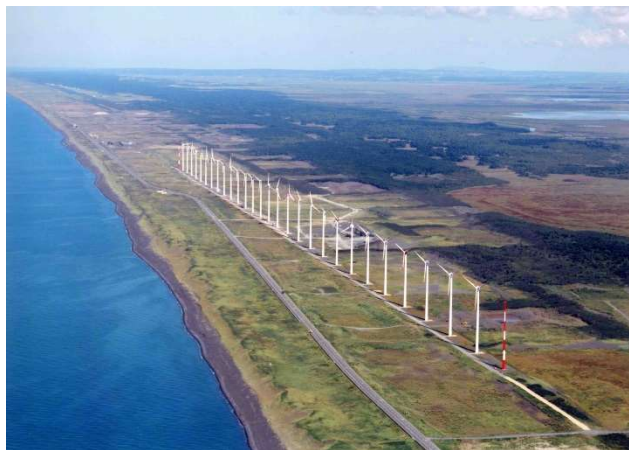
図2：発電用風車の設置例

図2は、風力発電用風車の設置例を示している。この設置場所が風力発電に適していると考えられる要因を2つ挙げ、それぞれの理由を説明せよ。